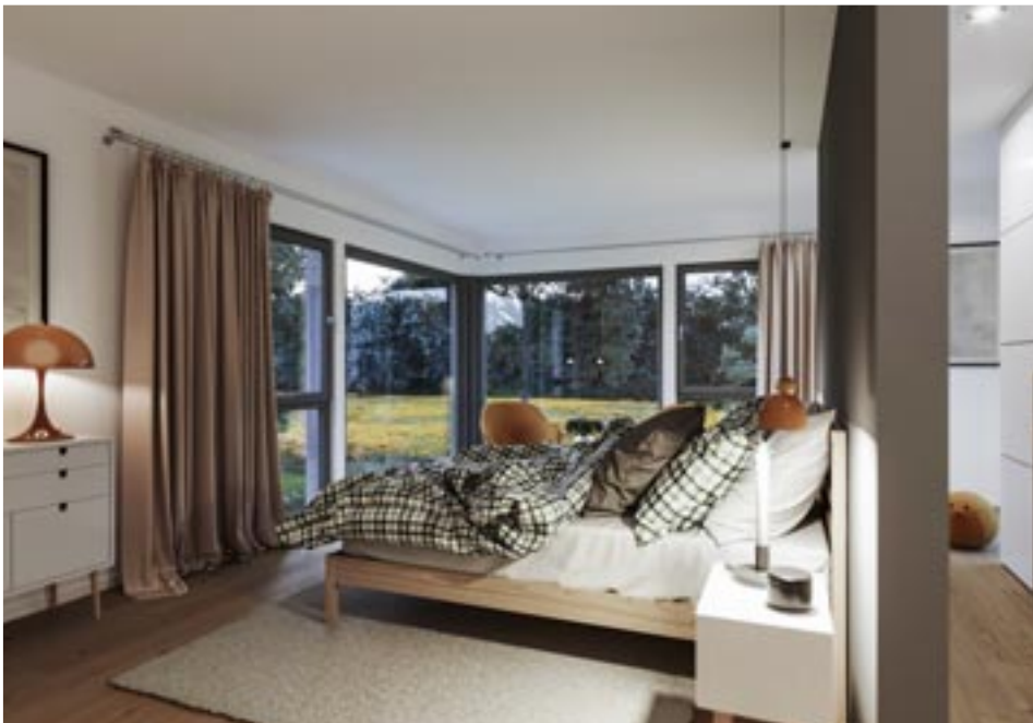
Viel Platz und viel Aussicht: Das Elternschlafzimmer im auskragenden Teil des Obergeschosses (siehe links) ist zugleich ein höchst attraktiver Aussichtspunkt.

ist im Hauspreis ein dreitägiges Coaching enthalten, in dem sich die Baufamilien von einem Profi der DIY Academy direkt in ihrem neuen Haus für die bevorstehenden Aufgaben fit machen lassen können. Natürlich sind Reisekosten und Unterkunft des Trainers ebenfalls im Preis enthalten.